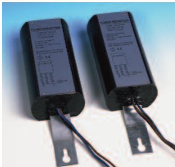
NT-30/150 och NT-30/400