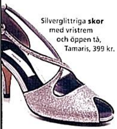
Silverglittriga skor med vristrem och öppen tå, Tamaris, 399 kr.