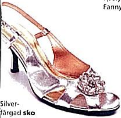
Silvrefärgad sko med öppen tå och glittrig blomma, Betty Blue, 649 kr.