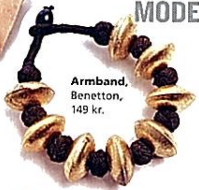
Armband, Benetton, 149 kr.