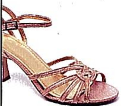
Rosa- och guldfärgade sandaletter med remmar, Sidewalk, 400 kr.