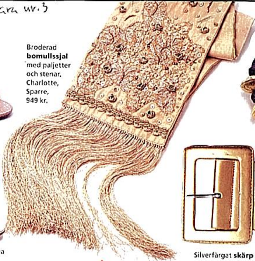
Broderad bomullssjal med paljetter och stenar, Charlotte, Sparre, 949 kr.