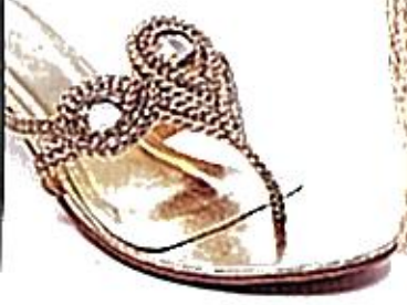
Tong-sandalett med dekorativa stenar, Tosca Blu, 799 kr.