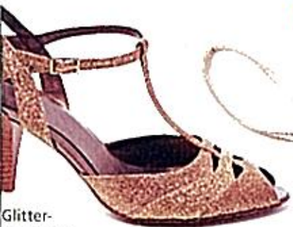
Glitterbeströdda t-sleifskor, Tamaris, 399 kr.