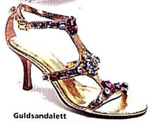
Guldsandalett med färgade stenar, Lollipop, 859 kr.