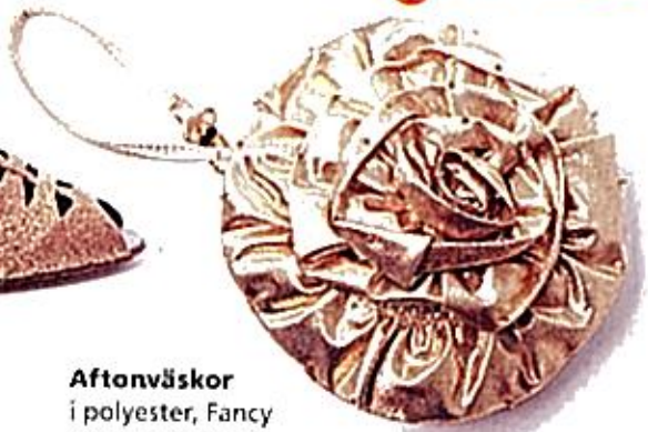
Aftonväskor i polyester, Fancy Fanny, 298 kr/st.